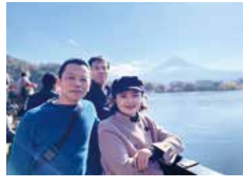
河口湖遊覧船天晴③