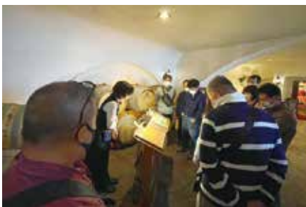
赤富士ワインセラー①