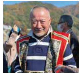
河口湖遊覧船天晴⑤