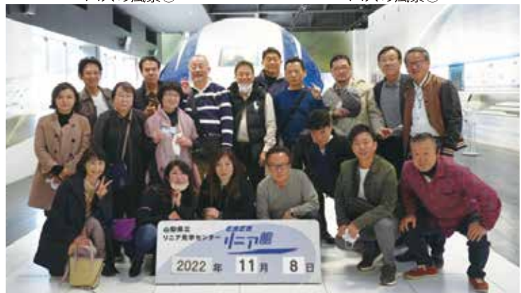
山梨県立リニア見学センター