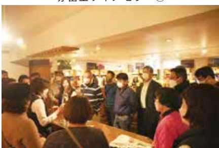
赤富士ワインセラー②