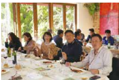
河口湖オルゴールの森美術館