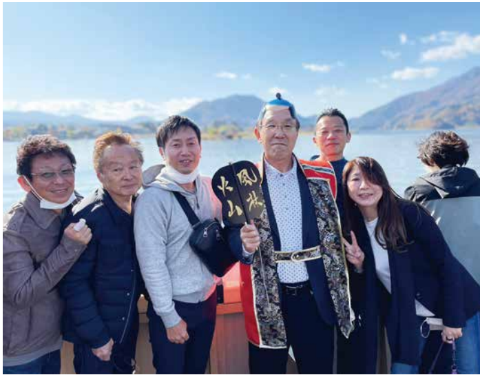
河口湖遊覧船天晴①