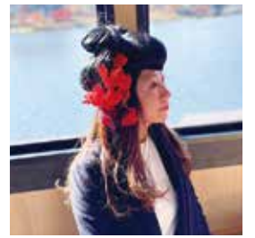
河口湖遊覧船天晴④