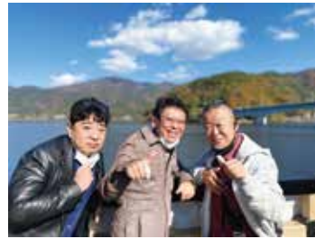
河口湖遊覧船天晴②