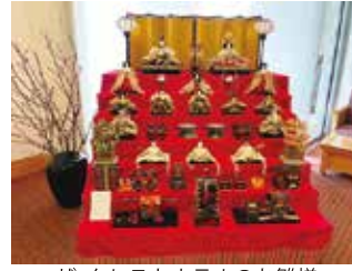
ザ・クレストホテルのお雛様