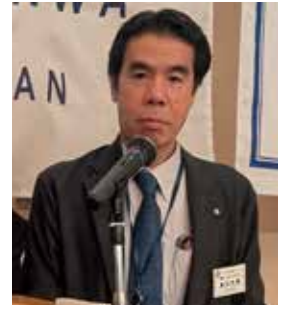
柏ロータリークラブ 2026-27年度 クラブ組織表

また、私は入会後4~5年は幽霊会員として不良ロータリアンでしたので、ロータリー云々と偉そうなことは言えませんので親睦に力を入れたいと思っており、多くの委員を配属させて頂いております。